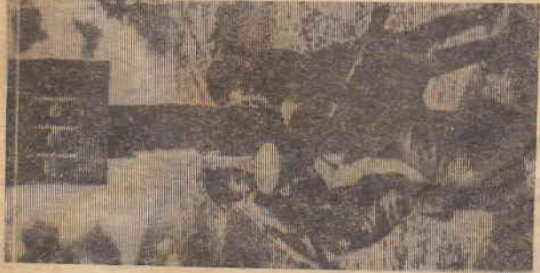
Бойцы 52 армии генерал-майора Рогозного устанавливают противотанковый столб на горах

После госпиталя я изучил снайперскую винтовку и был направлен на фронт, но по приказу командира полка майора Мамедова (второй Украинский фронт) был назначен начальником сборов снайперской подготовки. Обучил 30 человек